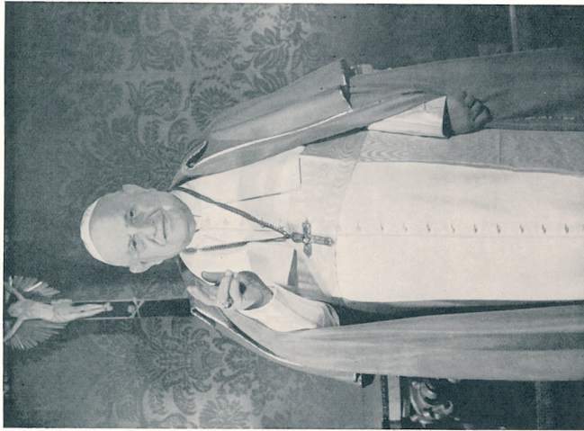
Sa Saineté Jean XXIII