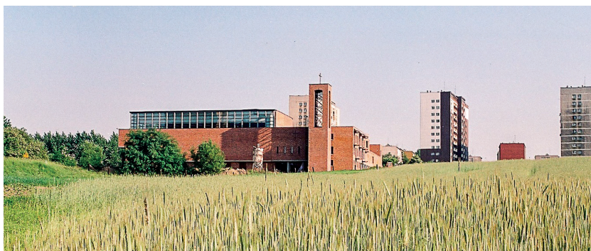
2. Zespół sakralny pw. NMP Matki Kościoła w Gliwicach – proj. arch. M. Polak, M. Bielski