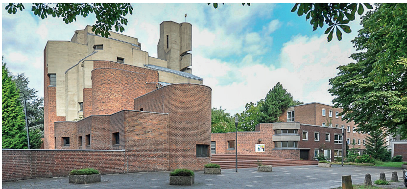
6. Kościół pw. Zmartwychwstania Jezusa Chrystusa w Kolonii-Lindenthal – proj. arch. G. Böhm