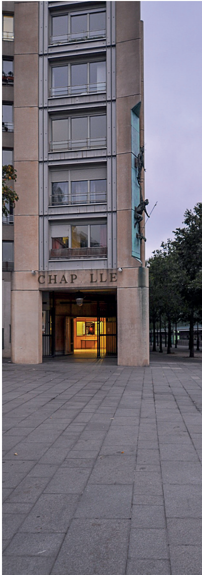
4. Katolicka kaplica De L'Agneau de Dieu w Paryżu