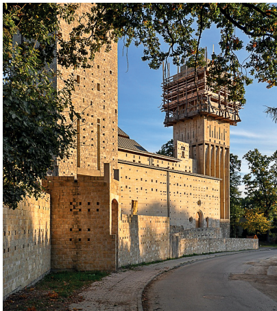
14–15. Zespół sakralny pw. św. Franciszka i św. Klary w Tychach – proj. arch. S. Niemczyk