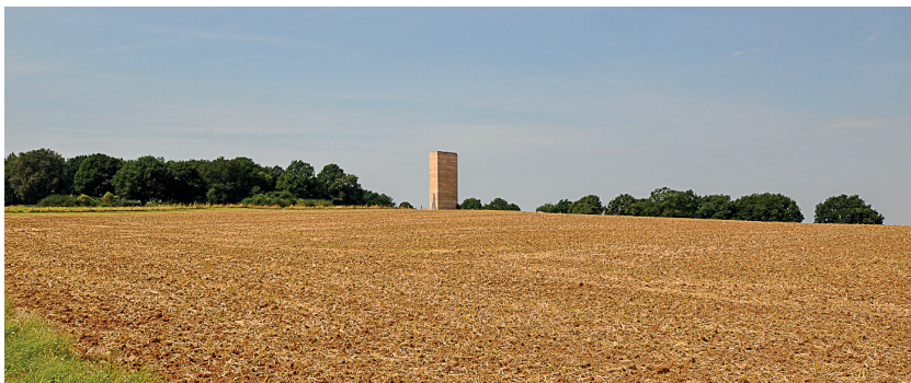
1. Kaplica Brata Klausa w Mechernich – proj. arch. P. Zumthor