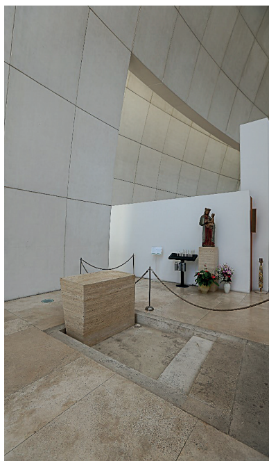
9-11. Kościół Roku Świętego 2000 w Rzymie – proj. arch. Richard Meier