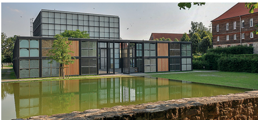
3. „Pawilon Chrystusa” z wystawy EXPO 2000 w Europejskim Centrum Formacji Młodzieży na terenie historycznego założenia klasztoru Cystersów w Volkenroda – proj. arch. Gerkan, Marg und Partner