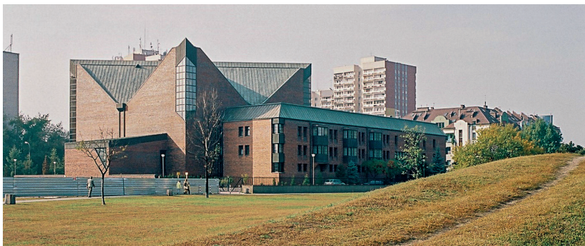
8. Kościół pw. Nawrócenia św. Pawła Apostoła w Warszawie – proj. arch. K. Kucza-Kuczyński, A. Miklaszewski, B. Osiński