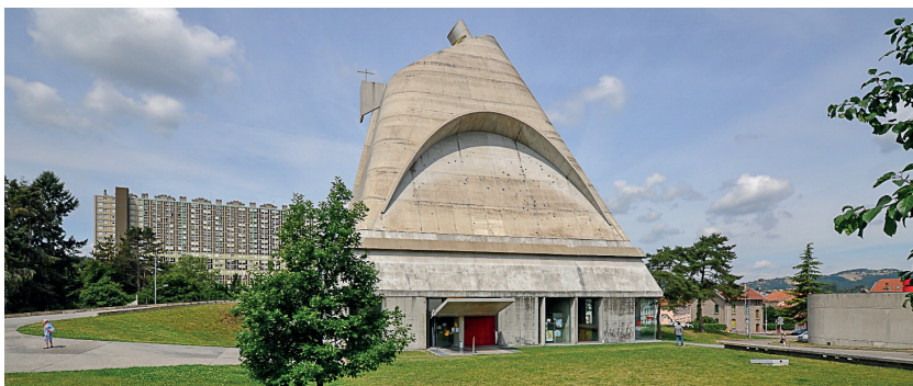
7. Kościół pw. św. Piotra w Firminy – proj. arch. Le Corbusier